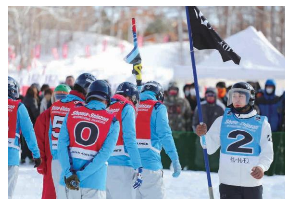
でいくさんズ神出 / NMT