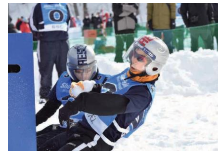
せたなレスキュー